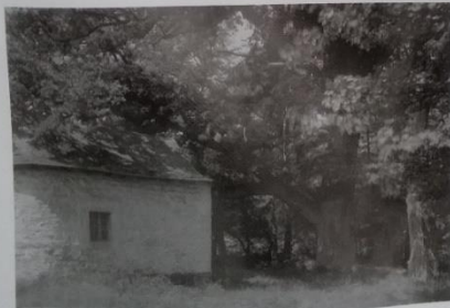
Chapelle Saint-Pierre

Cette chapelle serait construite à l'emplacement d'un ancien autel des druides. La fontaine toute proche est entourée de substructions romaines. On y aurait retrouvé une sculpture de saint Pierre.