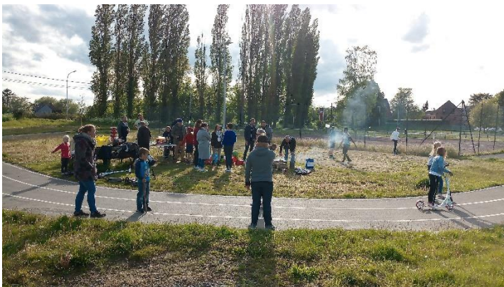
Photo illustrant la demande existante des beuzetois.