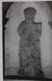
Sculpture (relief) de Saint-Pierre (c) KIK-IRPA, Bruxelles

Introduire une fiche commune BeLife/Beuzet en Fête nous a forcé à réfléchir sur l'avenir de nos structures et sur l'identité de notre village. L'espace barbecue, répondant à un besoin commun, a rapproché nos associations et permis d'envisager les premiers éléments d'une identité commune forte.